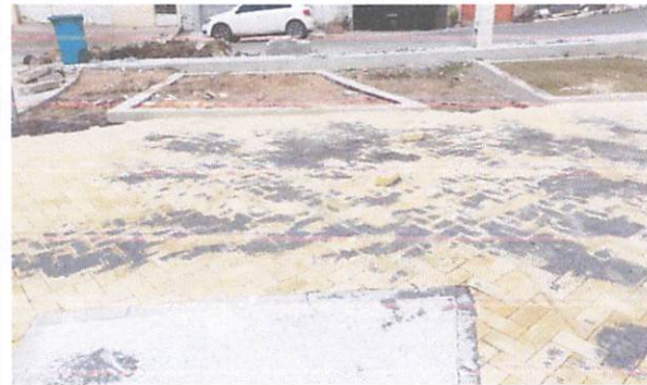
FOTO 6: Execução de passeio em piso intertravado, com bloco retangular amarelo