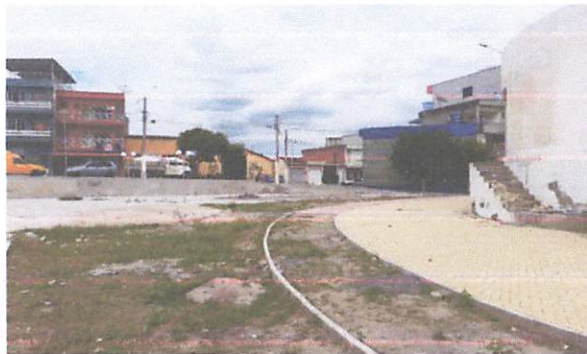
FOTO 5: Execução de passeio em piso intertravado, com bloco retangular amarelo e vermelho