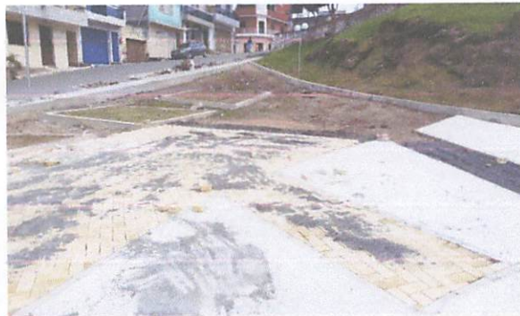
FOTO 10: Execução de passeio em piso intertravado, com bloco retangular amarelo