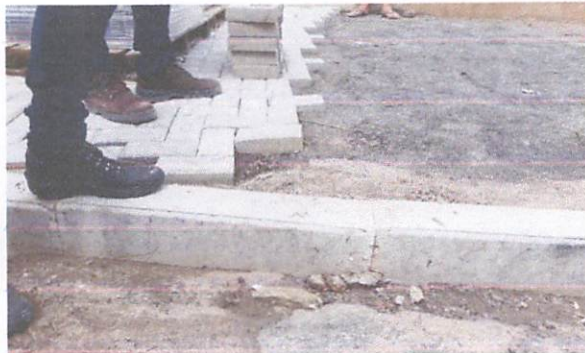
FOTO 8: Assentamento de guia meio-fio e execução de passeio em piso intertravado de cor natural