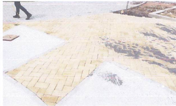
FOTO 4: Execução de passeio em piso intertravado, com bloco retangular amarelo