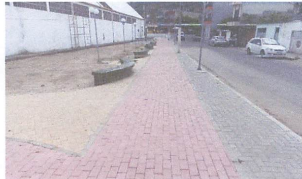
FOTO 12: Execução de passeio em piso intertravado, com bloco retangular vermelho