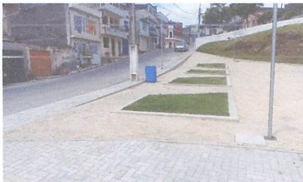
FOTO 11: Execução de passeio em piso intertravado, com bloco retangular amarelo