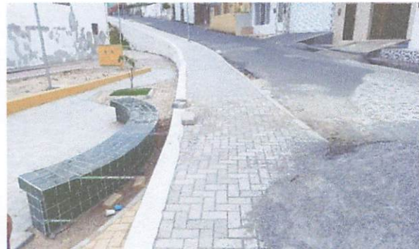
FOTO 10: Execução de passeio em piso intertravado, com bloco retangular Cinza