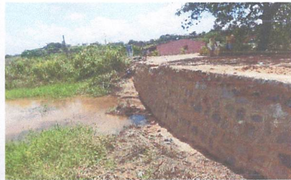
FOTO 6: Construção de muro de arrimo no Sítio Bela Vista/Brejinhos.