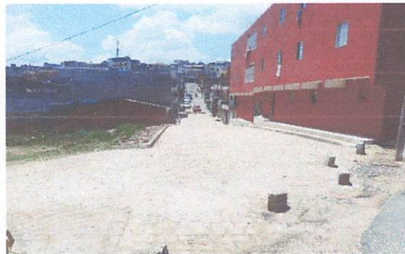
FOTO 11: Pavimentação em paralelepípedos na rua Sebastião José de Luna Filho.