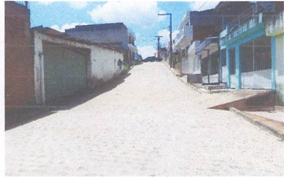
FOTO 8: Pavimentação em paralelepípedos na rua Adeildo Bastista de Oliveira.