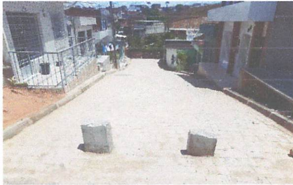
FOTO 7: Pavimentação em paralelepípedos na rua Adeildo Bastista de Oliveira.