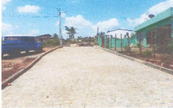
FOTO 1: Pavimentação em paralelepípedos no Sítio Bela Vista/Brejinhos.