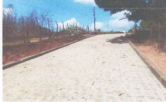
FOTO 2: Pavimentação em paralelepípedos no Sítio Bela Vista/Brejinhos.