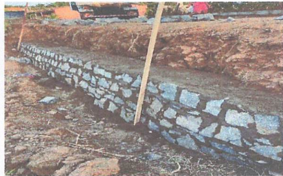
FOTO 4: Construção de muro de arrimo no Sítio Bela Vista/Brejinhos.