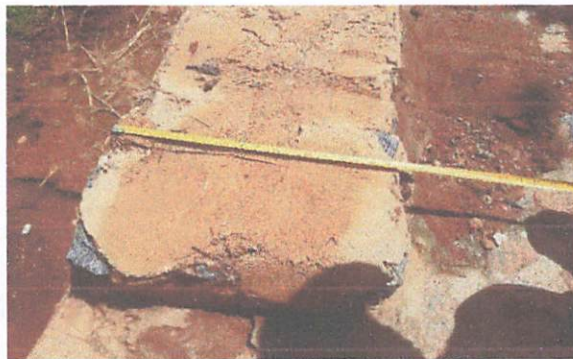
FOTO 5: Construção de muro de arrimo no Sítio Bela Vista/Brejinhos.