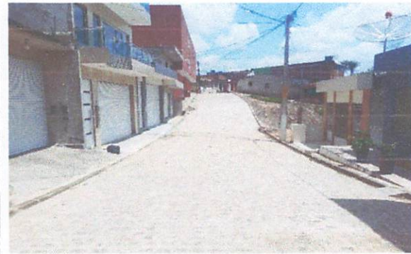
FOTO 12: Pavimentação em paralelepípedos na rua Sebastião José de Luna Filho.