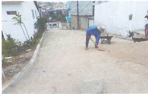
FOTO 9: Pavimentação em paralelepípedos na rua Ivenes de Oliveira.