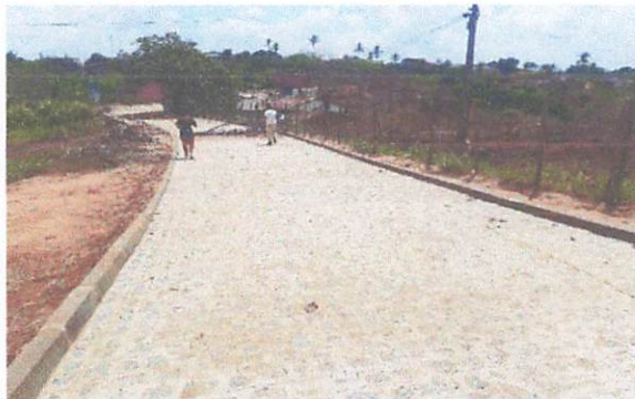
FOTO 3: Pavimentação em paralelepípedos no Sítio Bela Vista/Brejinhos.