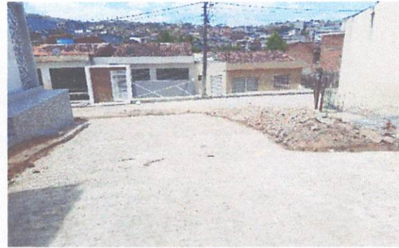
FOTO 10: Pavimentação em paralelepípedos na rua Ivenes de Oliveira.