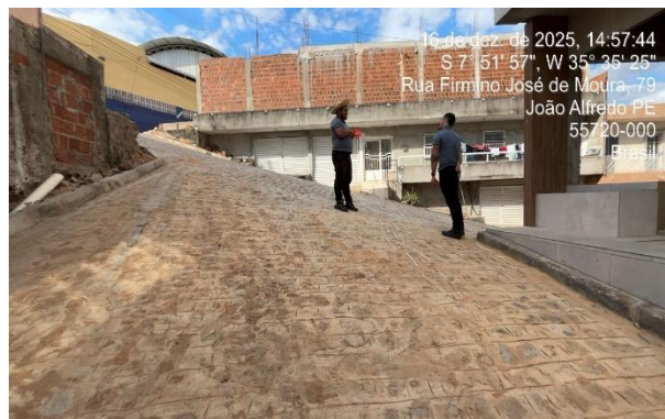
FOTO 8: Pavimentação na rua Antônio Severino de Almeida – Bairro Asa Branca.