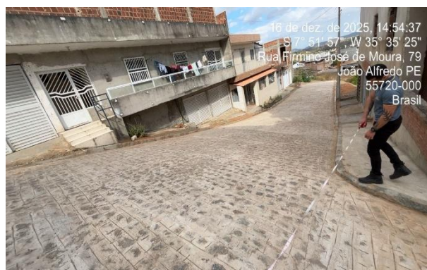
FOTO 6: Pavimentação na rua Antônio Severino de Almeida – Bairro Asa Branca.